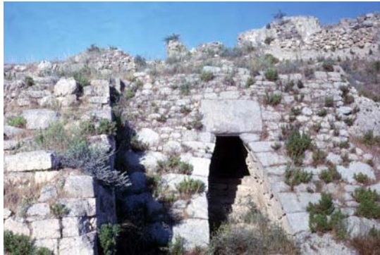
Ugarit (heute Ra's Shamra/Syrien) ab etwa 2400 v. Chr. keilschriftlich bezeugter kanaanäischer Stadtstaat. Hier fanden Ausgräber das älteste Alphabet in ugaritischer Schrift (1.400 Jh. v. Chr.)