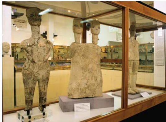
Statuen aus 'Ain Ghazal C14-Datierung/calibriert: 8041± 65BC (Archäolog. Museum Amman/Jordanien)