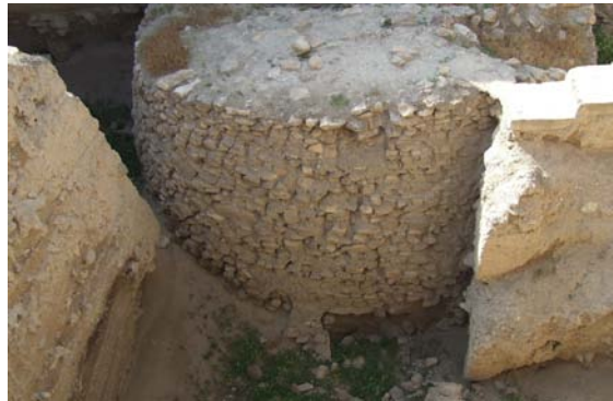
Jericho (1962 Jordanien, heute Westjordanland) Grabungsgelände Tell es-Sultan u. Turm (um 8.050 v. Chr.) Datierung: 8.800 v. Chr. bis 7.000 v. Chr. (Präkeramische Neolithikum B oder PPNB); Turm ca. 8050 v. Chr. der älteste heute bekannte Steinturm.