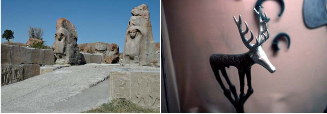
Alacahöyük ab der Mitte 3. Jts. v. Chr. Siedlung der vor-hethitischen, nicht-indogerman. Hattier; Sphingentor und Bronze-Statuette, 2.100-2.000 BC;