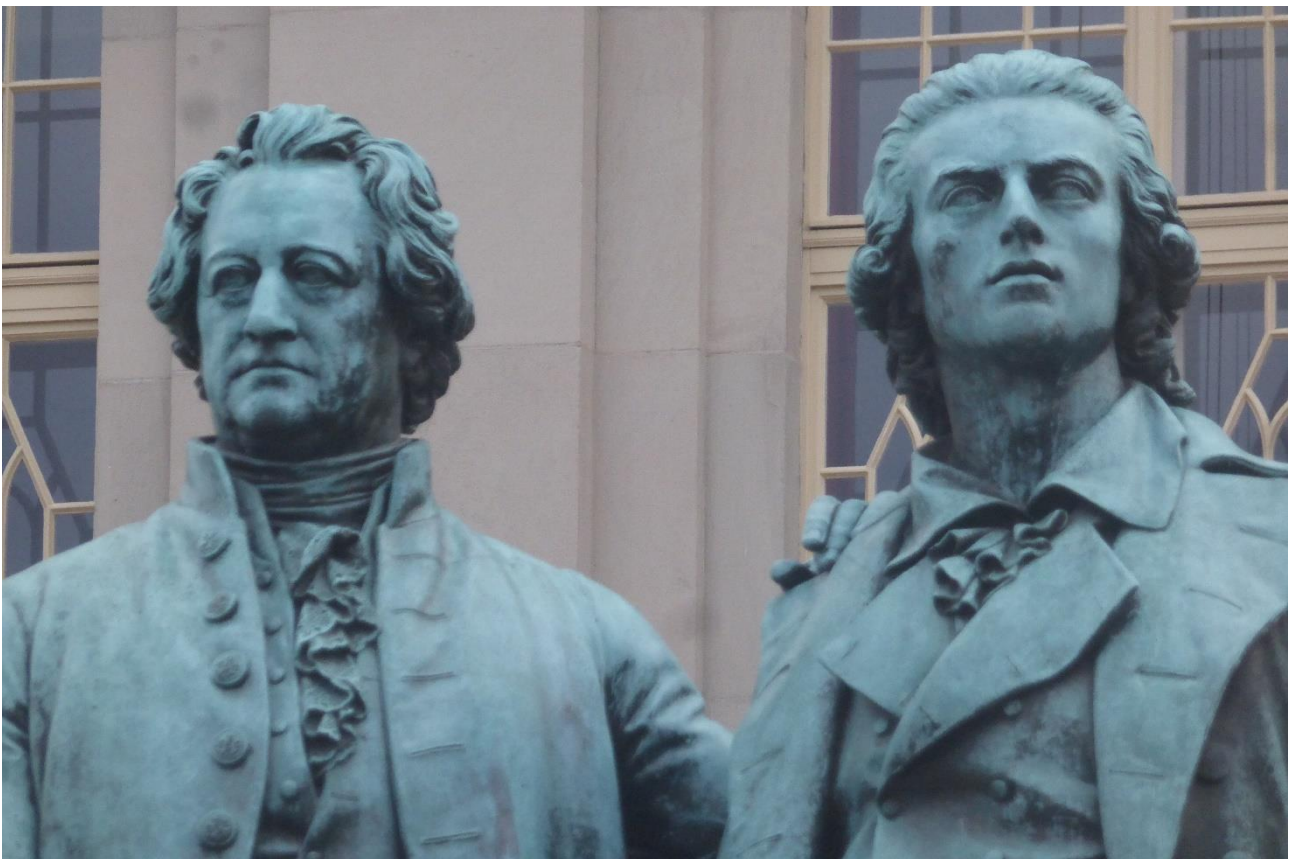
Goethe und Schiller in Weimar

Das Jahr 2020 hat unsere Reisegewohnheiten nachhaltig verändert. Statt mit dem Flugzeug in die Ferne zu schweifen, informiert man sich täglich neu über offene Staatsgrenzen. So entdeckt man das Naheliegende neu: Thüringen etwa, lange Jahre hinter dem Eisernen Vorhang gelegen, hat sich zu einer kulturellen Schatzkammer herausgemausert, in der man nicht nur Klöße isst. Die Heimat von Bach, Luther und Thomas Müntzer bietet wohl erhaltene Altstadtkerne und eine unzerstörte Landschaft, die im Harz gipfelt. Folgen Sie uns auf einer Spurensuche mit Goethe und Schiller zu Burgen und Domen und nicht zuletzt zur „Himmelscheibe von Nebra“!